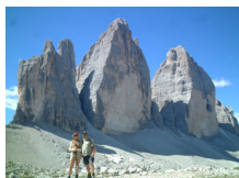
イタリア・ドロミテ