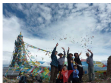
ネパール・トレッキング