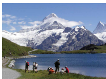
スイス・アルプス