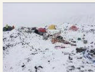
雪崩直後のエベレストBC

http://i-shishi.jp/sagasu/syakunage.html