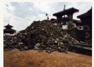
壊れてしまったカトマンズの歴史的建造物