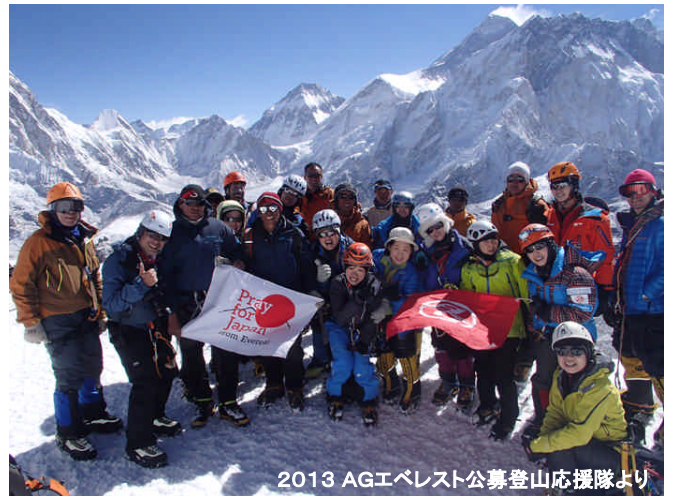
2013 AGエベレスト公募登山隊応援隊より

* 現地での日程は目安です。天候、ルート状況、参加者の高所順応の状況によって、予告なく変更される場合もございます。予めご了承下さい。